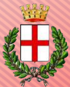
COMUNE DI CAMPOSAMPIERO