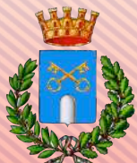
Comune di Montegrotto T