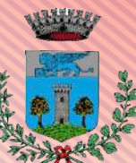
Comune di Cervarese S. Croce