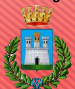
Comune di Adria