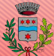
Comune di Cadoneghe