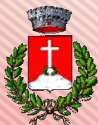
COMUNE DI ARQUA' PETRARCA