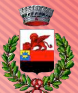
Comune di Montagnana