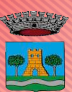
COMUNE DI SOLESINO