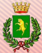
COMUNE DI ALBIGNASEGO