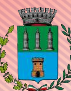
Comune di Mestrino